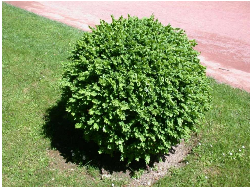
Buxinho moldado pela topiaria

O buxinho é uma planta arbusto e lenhosa, muito utilizada para a topiaria, por suas inúmeras qualidades. Sua folhagem verde escura é resistente e regenera-se bem das podas semestrais.