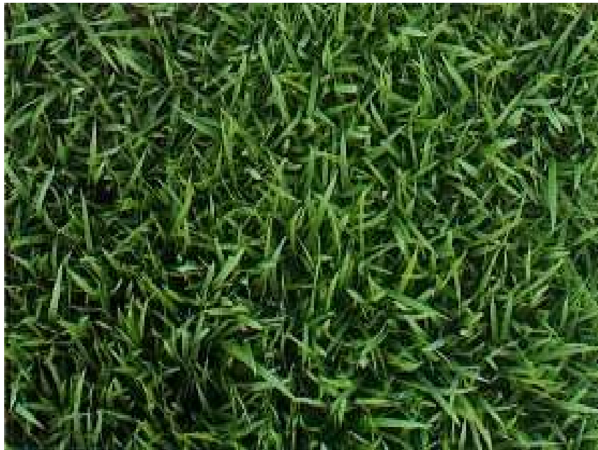
Grama Esmeralda ( Zoysia japonica )

Beijos de Sol (Impatiens), pode até parecer um nome estranho, mas é a denominação dada a uma planta bastante conhecida, e que produz flores lindas, coloridas e bem alegres. Ela é comumente encontrada no hemisfério Norte e nos trópicos. Além de receber o nome de impatiens, ainda é chamada de Bálsamo, Jewelweed, e também de não-me-toques e muitos outros nomes, especialmente no Brasil.