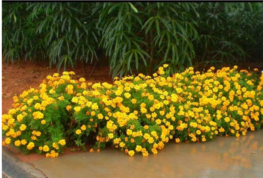
Lantana pendente amarela (Cambará)

A lantana é considerada como arbusto perene e pode ser utilizada para a formação de canteiro, bordadura e cerca-viva. A variedade escolhida dará ao canteiro a presença de inflorescências que, em conjunto, tendem ao amarelo, fazendo bom contraste com a folhagem verde escura