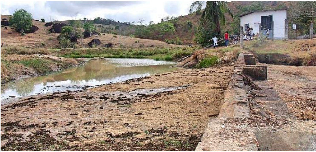
Ponto de captação da Cesan no Córrego do Socorro

O novo ponto fica situado exatamente no local onde a Cesan faz a capacitação de água que abastece a cidade, no Córrego do Socorro, zona rural, distante cerca de 7 quilômetros da sede do município.