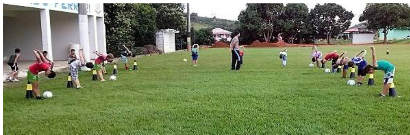
Mesmo com poucos recursos disponíveis o município está dando um novo rumo ao setor

Pensando no futuro do esporte local, o secretário elaborou e enviou aos parlamentares capixabas vários projetos, entre eles, a construção de arquibancadas no estádio municipal; construção de alambrados e vestiários no campo da Comunidade Milk e a troca da grama sintética do campo Bom de Bola no bairro Ondina, que se encontra sem condições de uso.