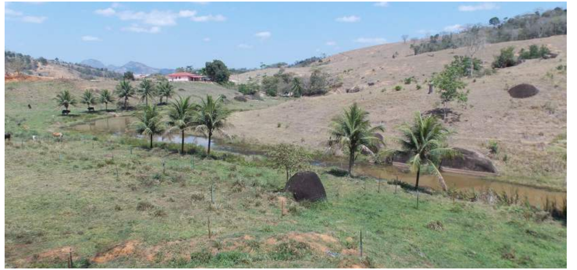
Vista parcial da área onde está sendo projetada a barragem

A pós novos estudos, os técnicos do Governo do Estadual decidiram mudar o local onde será projetada a primeira barragem de grande porte no município de Vila Pavão. O novo ponto fica situado exatamente no local onde a Cesan faz a capacitação de água que abastece a cidade, no Córrego do Socorro, zona rural, distante cerca de 7 quilômetros da sede do município.