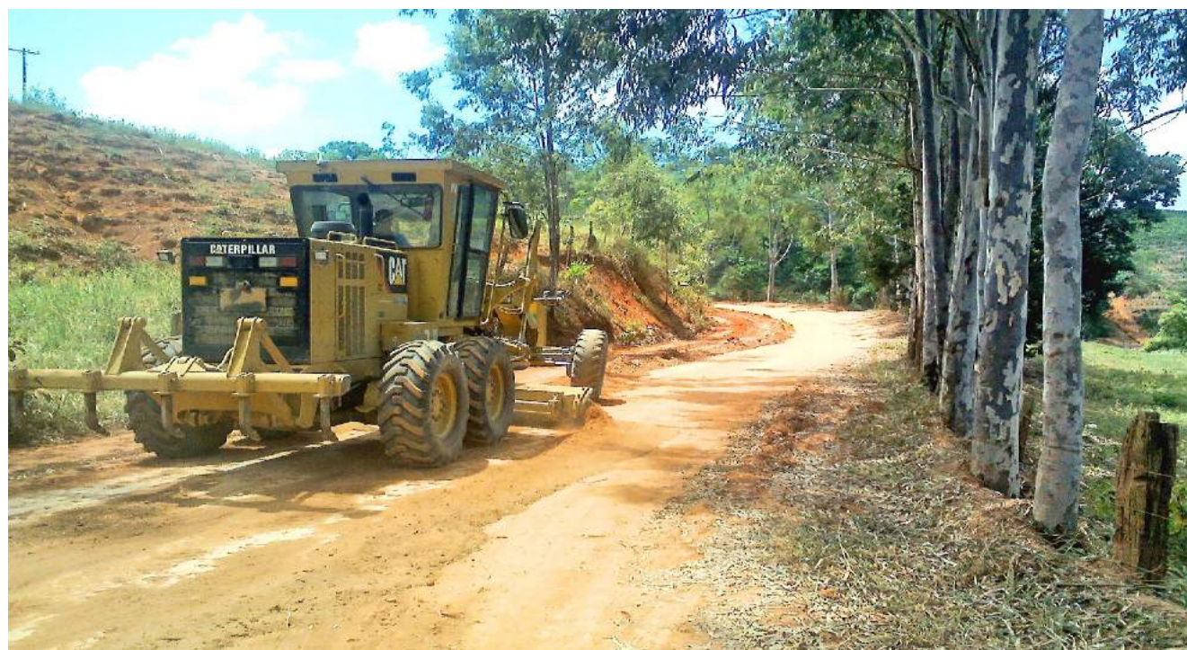
Grande parte das estradas do município encontram-se patroladas

O secretário municipal de Obras enfatizou que todas as estradas do município estavam intransitáveis, o que vinha causando grandes transtornos principalmente à população interiorana, afetando