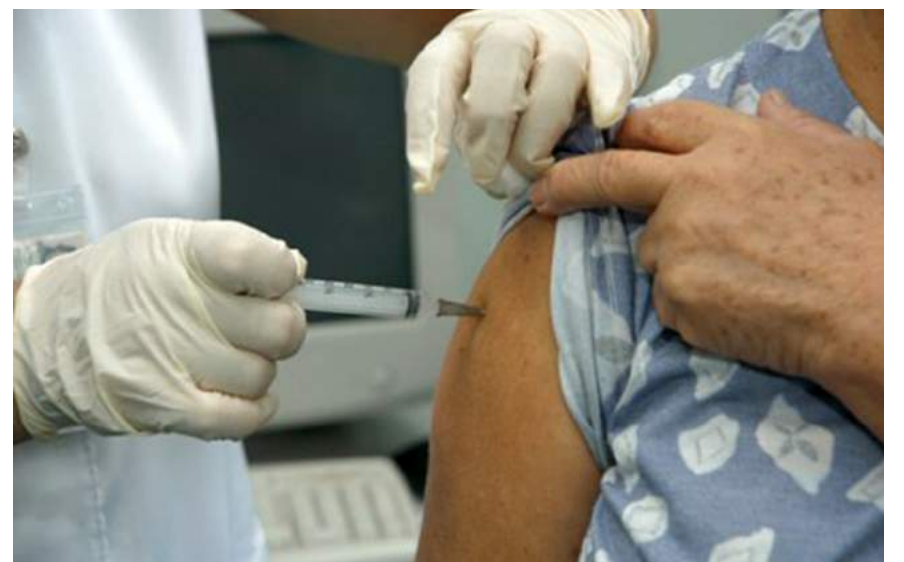
Vacinação continua na Unidade de Saúde da sede

O secretário afirma que não há motivo para o pavoense se preocupar com a febre amarela, isso porque, até o momento, não houve nenhuma suspeita da doença no município.