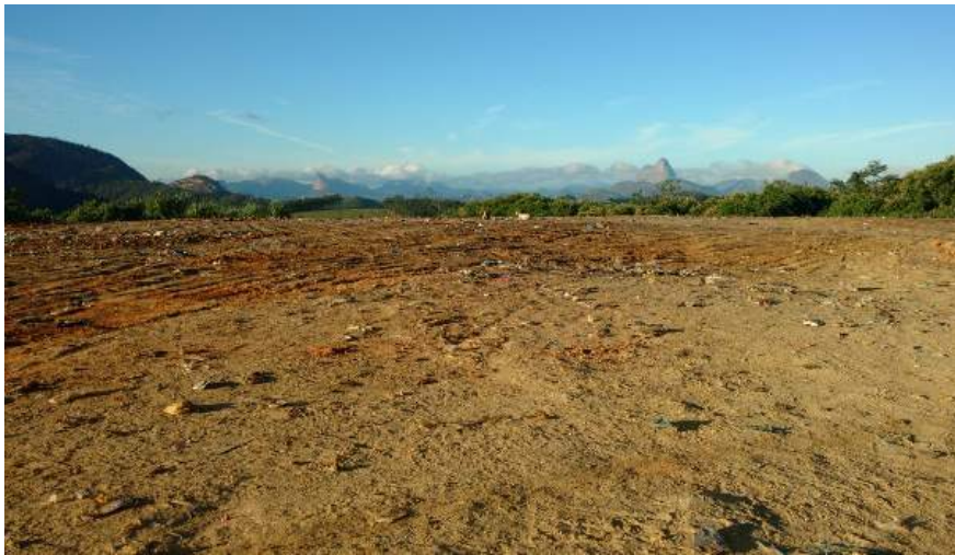
Os resíduos agora passaram a ser enterrado para não causar risco à saúde da população e nem danos ao meio ambiente

Atualmente não existe mais na cidade lixo depositado a céu aberto ou sendo queimado causando risco à saúde da população ou danos ao meio ambiente, como por exemplo, contaminação do solo e do lençol freático